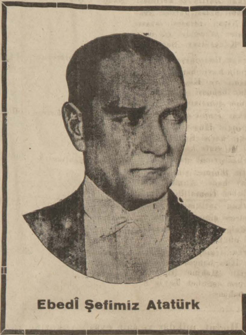
Ebedî Şefimiz Atatürk

Havacılıkla kısa zamana çok iş sığdırmak zorunda bulunuyoruz. Türk Hava Kurumunun önünde açılan yeni hizmet uçakları milli hava gücümüze bugüne kadar eksikliğimizi duyduğumuz yeni eserler kazandıracaktır. Kurumun muvaffak olabilmesi için yardımlarımızı sıklaştıralım.